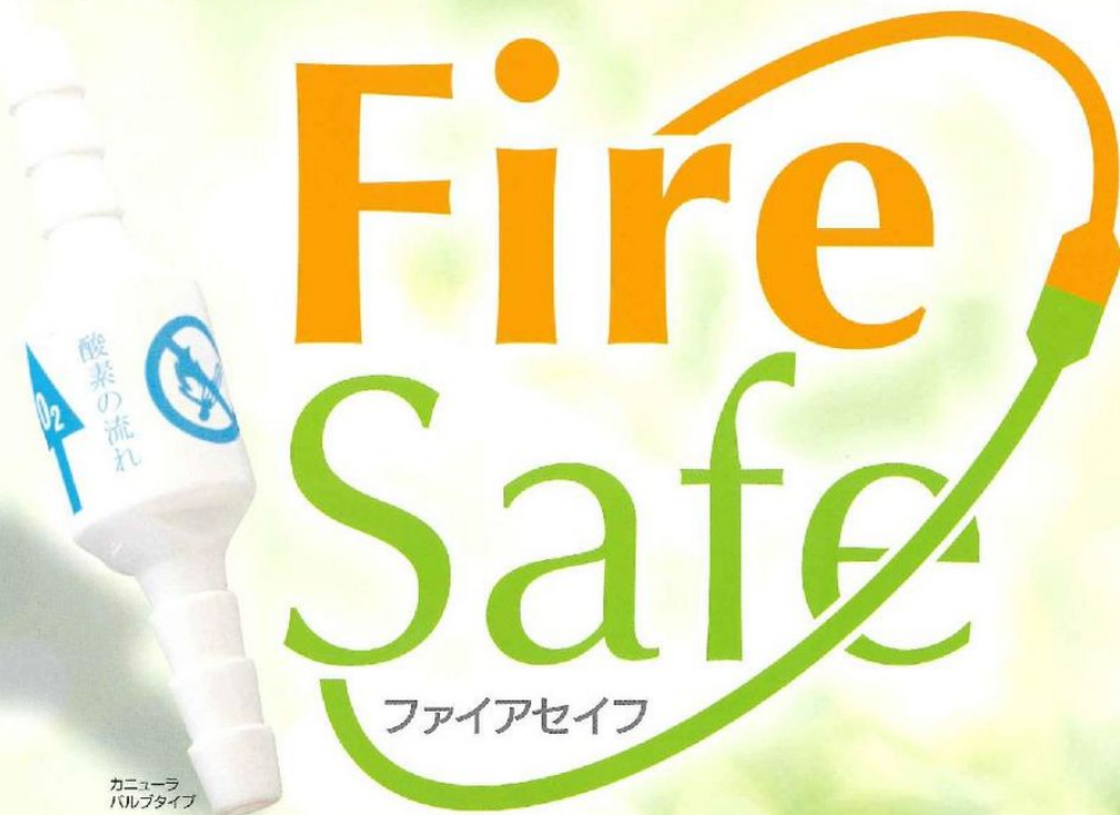
カニューラ バルブタイプ

ファイアセイフは、万が一の酸素チューブ発火時に、ヒューズのように機能して酸素供給を自動的に止め、酸素による火災への影響を最小限に抑えます。