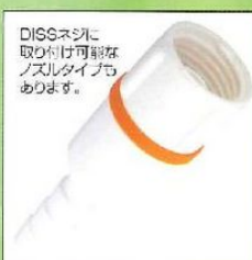
DISCネジに 取り付け可能な ノズルタイプも あります。

ファイアセイフを取り付け、機能を説明することにより、患者様、またその家族への禁煙、火気厳禁の重要性を改めて認識させることができ、ファイアセイフの存在が、禁煙、火気厳禁の注意を促します。