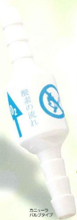
カニューラ バルブタイプ