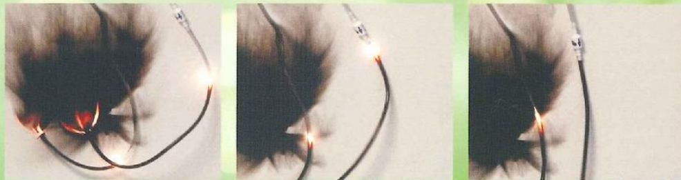
左: ファイアセイフを取り付けていないチューブ 右: ファイアセイフを取り付けたチューブ

ファイアセイフが延焼を防止する様子です。 ファイアセイフに火が到達すると、チューブの延焼をしっかりと止めます。