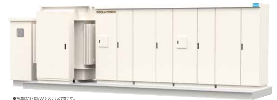
*写真は1000kWシステムの物です。

省エネ大賞受賞の`エアコン`レス、 パワーコンディショナを搭載。 高効率&スマートを実現した太陽光 発電特高変電設備パッケージ。