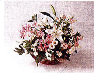
アレンジメント・・・11,000円