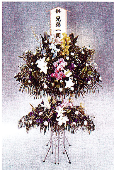
2段スタンド型 27,500円~33,000円