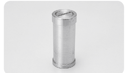
●型式記号・仕様・価格表 □材質/SUS304