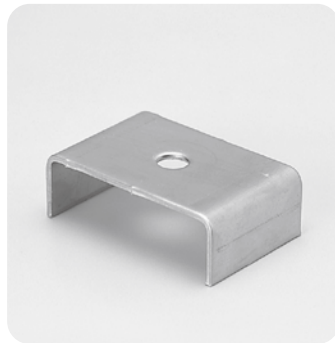
●型式記号・仕様・価格表