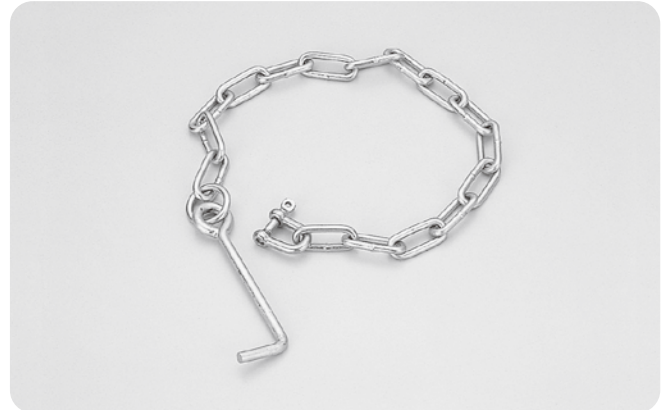
●型式記号・仕様・価格表