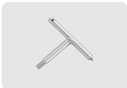
●型式記号・仕様・価格表 □材質/SUS304