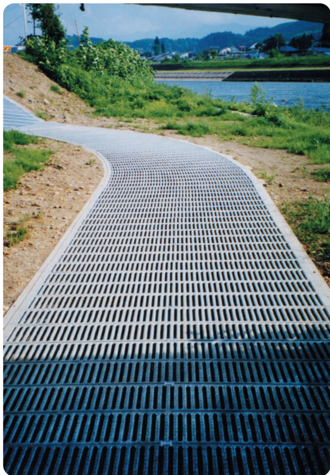
▲クリークウォーク広幅用