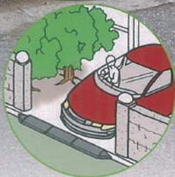
●車庫入口(自動車の出入)