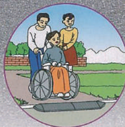
●バリアフリーに貢献 ●車イスにも使用できます