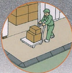
●作業場入口 (キャリアラック・一輪車)