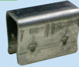
OC (ステンレス製連結用クリップ)