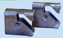
C (ステンレス製連結用クリップ)