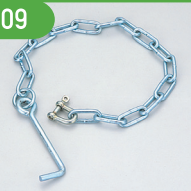
BK/SBK (シャックルアンカー クサリ付)