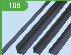
BG (パッキン各種) (騒音緩和用ゴムパッキン)