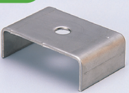
SBC (ボルト固定用キャップ)