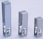
GC (ステンレス製連結用クリップ)