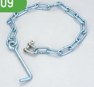
BK/SBK (シャックルアンカー クサリ付)