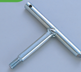
SIH (取手インサート用ハンドル)