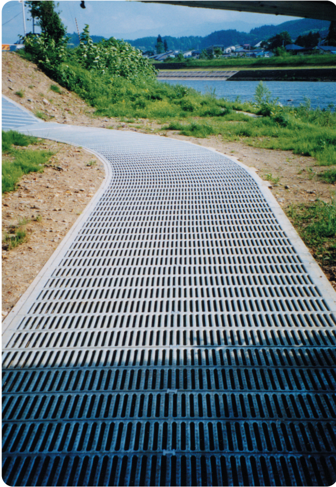
▲クリークウォーク広幅用