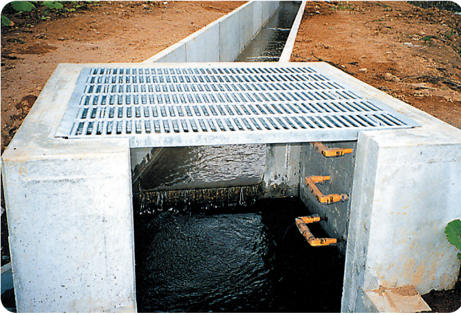
▲クリークウォークマス蓋