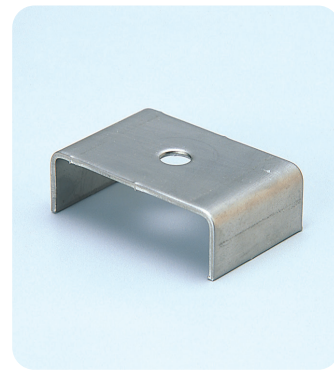
●型式記号・仕様・価格表