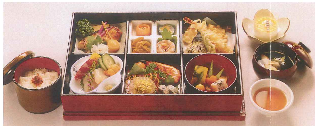
やまぶき 山吹 6,500円