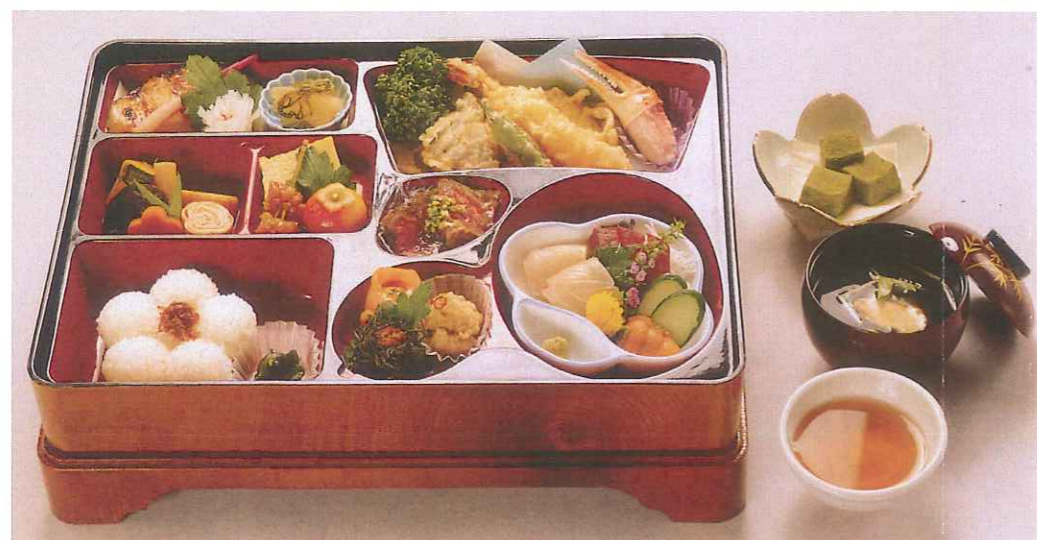
さざんか 山茶花 5,300円