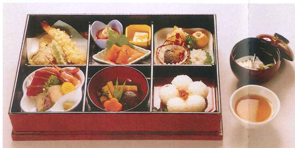
ききょう 桔梗 4,600円