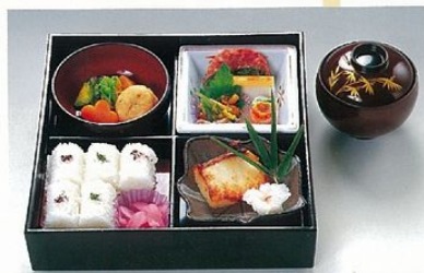
わかば 若葉 2,500円