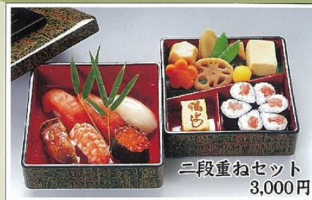
三段重ねセット 3,000円