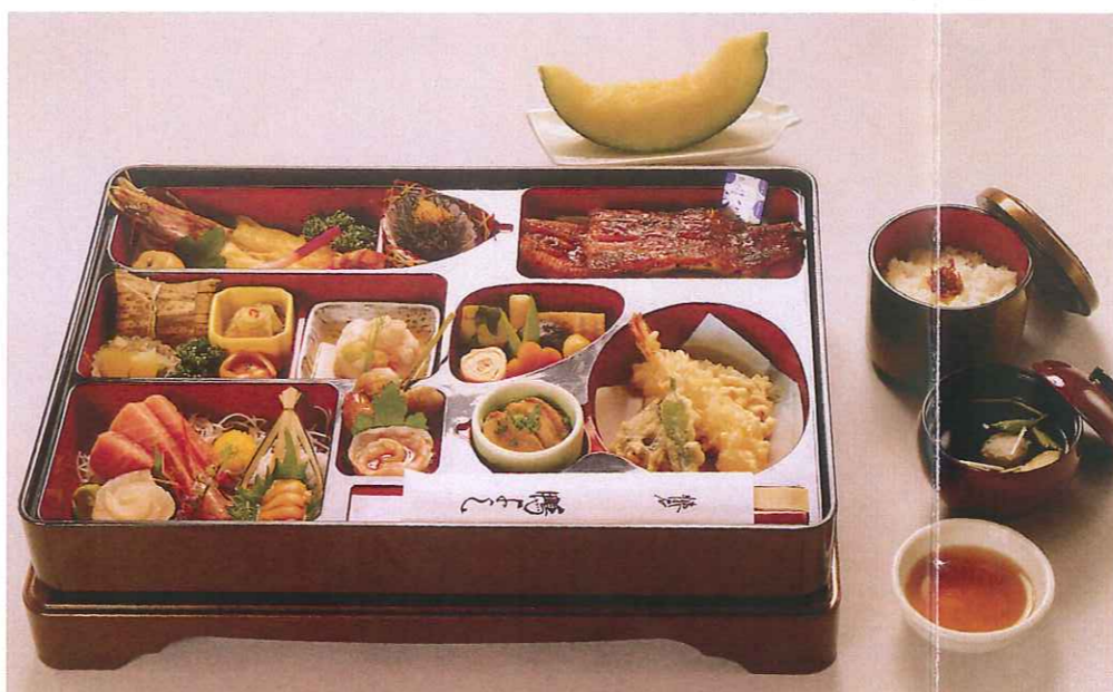
あおい 葵 9,000円