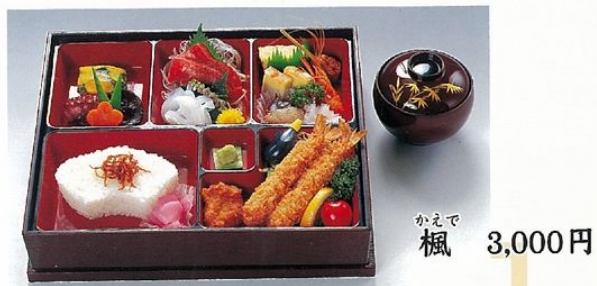
かえで 楓 3,000円