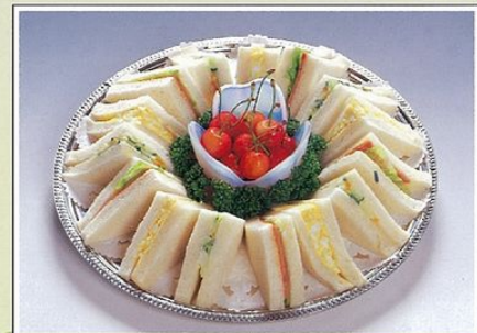
サンドイッチ 3,500円 (10月~5月の期間となります)