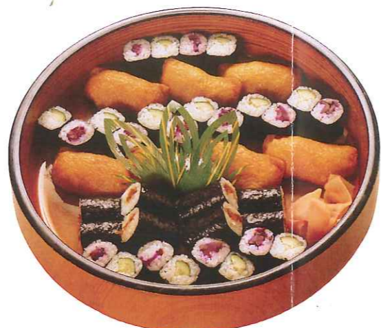
のり巻き・いなり 3,000円