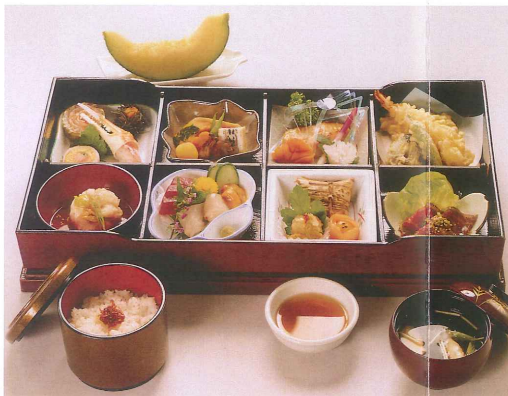
しらゆり 白百合 7,500円