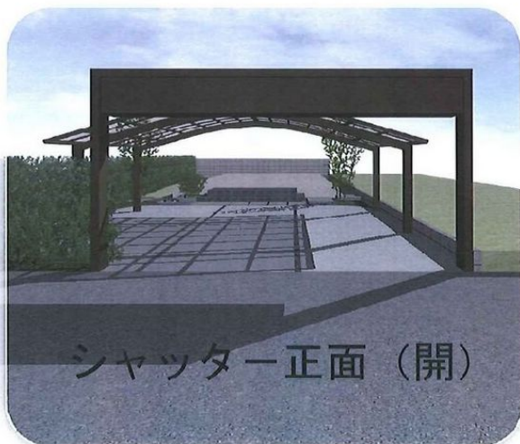
シャッター正面（開）