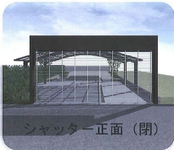
シャッター正面（閉）