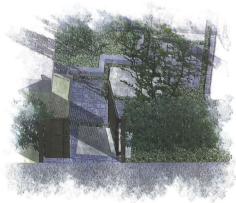
門扉裏入り口付近