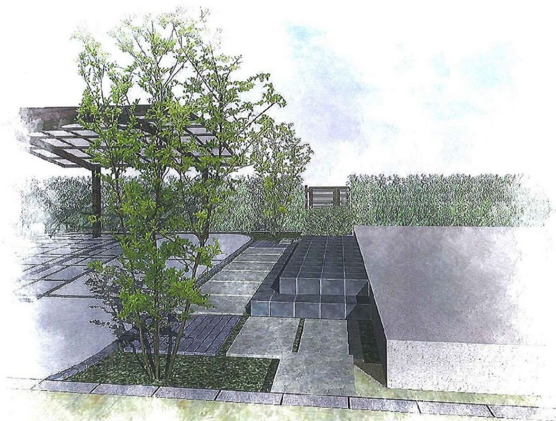
階段より玄関前付近