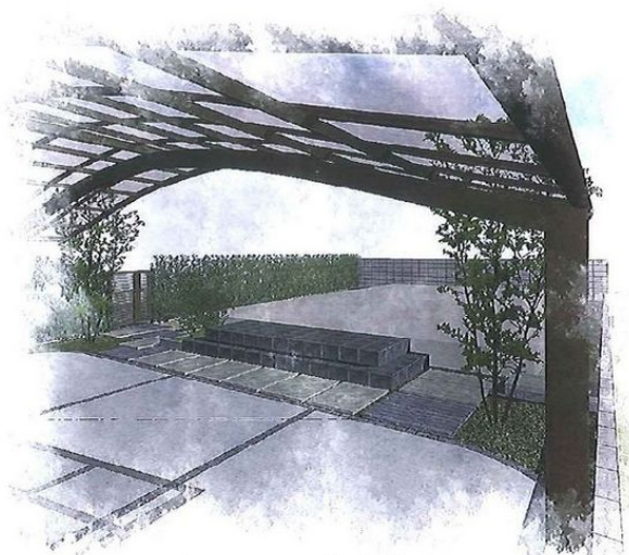
車庫中より玄関前付近