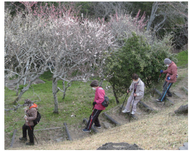
会話を楽しみながら登る

塩屋柏台パールクラブ健康山歩会は、旗振山に毎日登山している人たちが昨年結成されました。現在会員は16名です。ちなみに旗振山に今年毎日登山している神戸市民山の会毎日登山奨励会