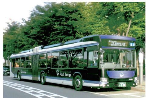
2両連節の神姫バス

神戸の観光地、神戸港。このたび新神戸駅〜ウオーターフロント間に2両連結の連節バスが運行されたので乗ってみました。