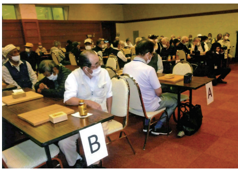
囲碁50名 将棋18名が参加

令和2年2月に始まった新型コロナウイルスの影響により、種々の制限がかけられ思うように開催できませんでしたが、昨年11月28日(日)開催後6カ月ぶりに第67回囲碁・将棋大会が5月22日(日)農業公園で開催されました。囲碁50名、将棋18名計68名の参加があり、囲碁・将棋ともA・B・Cと実力に合う3グループに分かれ、消毒・マスク着用で盤と向かい合い着席、対戦開始となりました。参加者の大部分の方々は、普段の十分な練習も