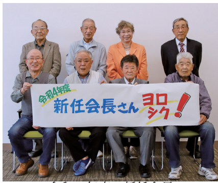
令和4年度の新任会長