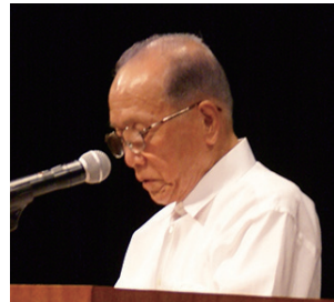
大辻理事長の開会あいさつ