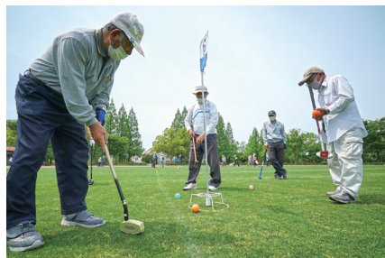
随所でナイスショットが見られた

院、常寂光寺、といった名刹の前を通って、人気の観光名所・竹林の小径へ。幽玄かつ優雅な雰囲気を楽しみました。ゴールは嵐山渡月橋、数か所に分かれて昼食をとり、帰途につきました。11日はほぼ曇天、13日は終始小雨が降る天気となりましたが、ほとんどのの方がコースを完走されました。