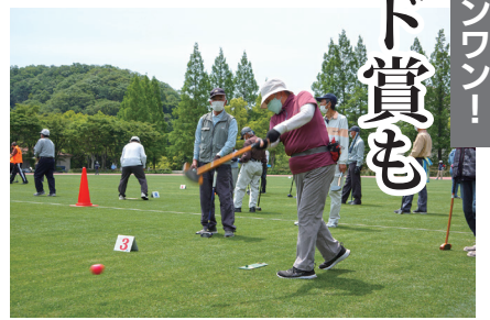
快音響させる一打目