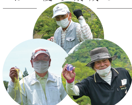
ホールインワン！ 喜びの表情