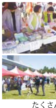
たくさんの方にご購入いただきました