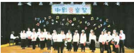
御影音楽祭に出演