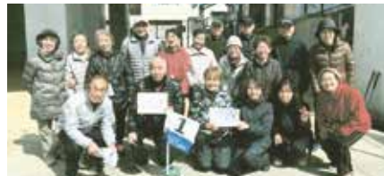
グラウンドゴルフショートコース選手権大会

「笑和会」の名の通り、笑顔と笑い声があふれる『中御影笑和会』であり続けたいと願っております。