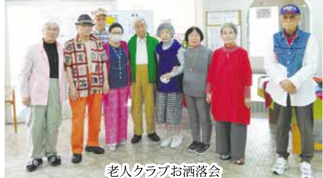
老人クラブお洒落会