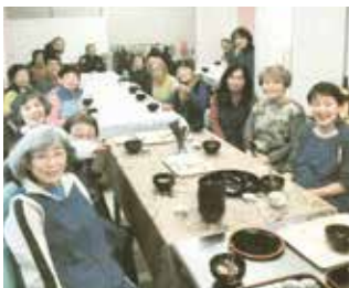
新年会は焼き餅入りのぜんざいでお祝い