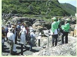
案内風景(イメージ)

ガイドが案内する室戸岬サイトは、室戸ジオパークの中でも特に地質遺産が集中しているエリアです。目の前にある岩や地層の特徴を分かりやすく教えてくれる他に、室戸の地域文化やガイド自身の体験談も交えた楽しいツアーを実施中。