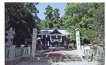
秦神社 元親を祭神として祀る