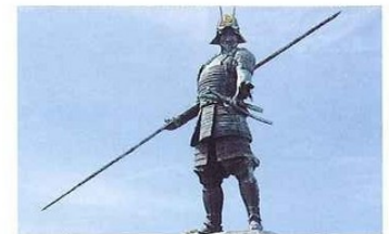
長宗我部元親初陣の像