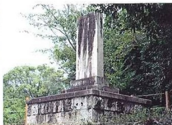
浦戸城跡 高知県立坂本龍馬記念館周辺に碑と散策路がある