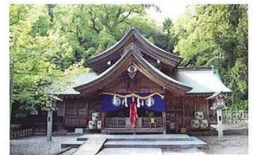
若宮八幡宮 初陣の戦勝を祈願