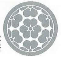
長宗我部家の家紋 なつかわたばみ 七鳩酢草

戦国の世に、土佐の一領主から身を起こし、四国をほぼ統一した武将、長宗我部元親。代々の本拠地であった岡豊城、そして海に面した新天地、桂浜は浦戸城。両エリアの史跡やミュージアムを訪ねれば、今の世にも残る元親の輝きが、鮮やかに迫ります。