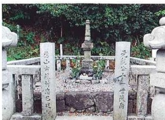
長宗我部元親の墓 愛馬の内記黒(ないきぐろ)も近くで眠る