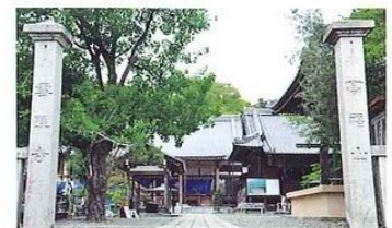
第33番札所 雪蹊寺 元親の法号にちなむ名