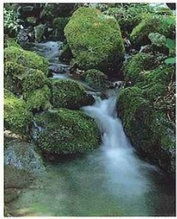
① 四万十川源流点 ☎0889-55-2021 (津野町産業建設課)