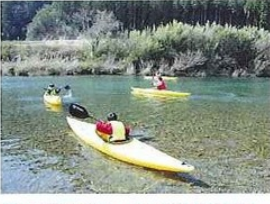
④ 天満宮前キャンプ場でのカヌー ☎0889-40-2892 (NPO四万十ナイスリバー・プロジェクト事務局)