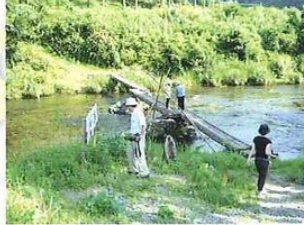
② 早瀬の一本橋 四万十川支流(北川川)にかかる木の橋 ☎0889-55-2021 (津野町産業建設課)