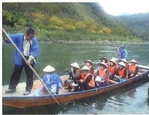
⑦ 川舟下り ☎0880-29-1005 (四万十かつば組合)