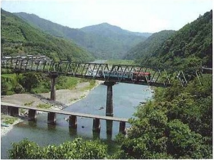
⑥ 第一三島橋とトロッコ列車 しまんとグリーンラインと呼ばれるJR予土線をトロッコ列車で体感。トロッコ列車のお問合せは ☎087-825-1635 (JR四国営業部販売促進課)