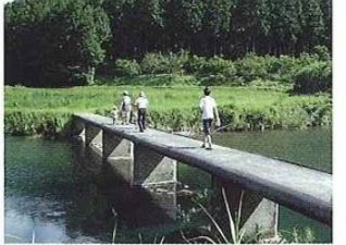
③ 高樋沈下橋 四万十川最上流にかかる沈下橋 ☎0889-52-2473 (中土佐町水産商工課)