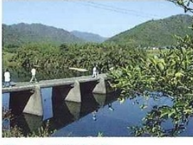
⑤ 一斗俵沈下橋 四万十川に現存する最古の沈下橋。昭和10年建設。国の登録有形文化財 ☎0880-29-6004 (四万十町観光協会)