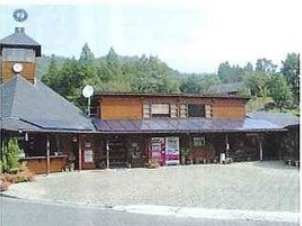
⑧ オートキャンプ場ウェル花夢 ☎0880-27-1211 (ウェル花夢)