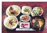
脱藩定食 龍馬ストラップ