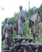
維新の群像(中央が龍馬)