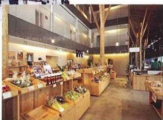
まちの駅ゆすはら

平成22年8月28日にオープンした「まちの駅ゆすはら」。茅葺きをイメージした鉄筋コンクリート3階建ての1階は梶原町の物産館、2、3階は「雲の上のホテル」の別館「マルシェ・ユスハラ」。部屋数は22~47㎡の15室で収容人数34名、宿泊料金は1人6,500円~9,000円(税別)。物産館にホテルが併設されるという全国でも初めてのケースで、「四国・ゆすはら・宿場町」を目指す町の拠点として期待されている。