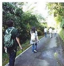
牧野ウォークコース

●今ノ山ウォークコース 足摺半島最高峰(865m)の今ノ山は晴れた日には九州を望むことができる。推移帯を代表とするモミ、アラカシの天然林と林床に珍しいシュスラン、ヒメムカゴシなどの植生が見られる。