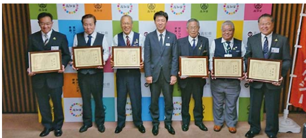
受賞者(写真左より)