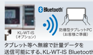
タブレット等へ無線で計量データを 送信可能にする、KL-WT-IS Bluetooth データ送信ユニット(オプション)