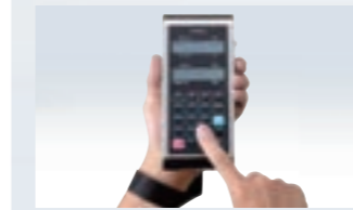
KL-DT2-ISデータキャリア(オプション)