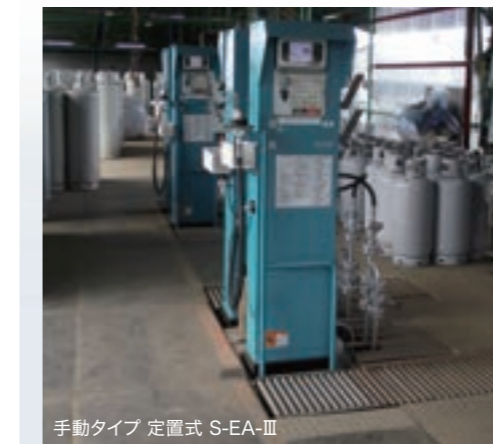
手動タイプ 定置式 S-EA-III