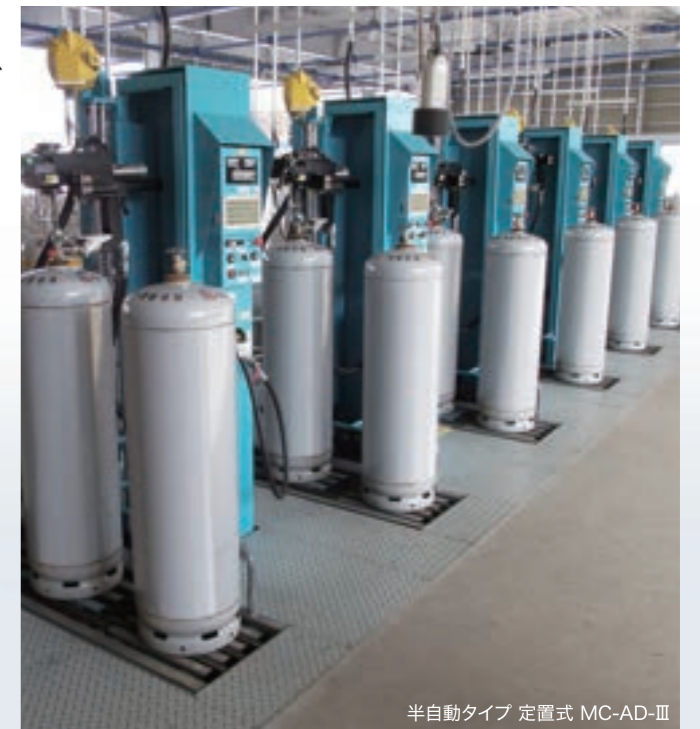
半自動タイプ 定置式 MC-AD-II