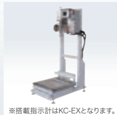
※搭載指示計はKC-EXとなります。