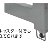
キャスター付でも 立てられます