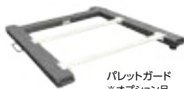
パレットガード ※オプション品