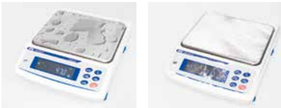
粉塵の舞う環境や、水滴がつくサンプルでも安心して計量