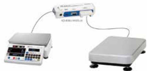
外部スケール装着イメージ図