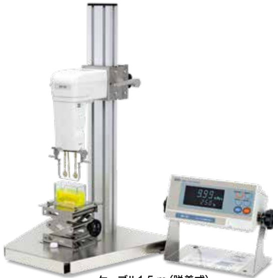
ケーブル1.5 m (脱着式)