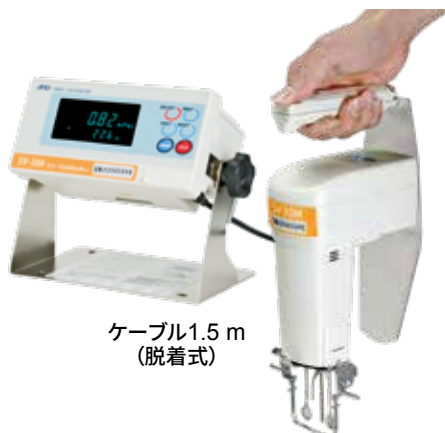
ケーブル1.5 m (脱着式)