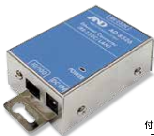
EtherNet/IPコンバータ : P93参照