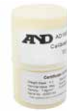
プラスチックケース