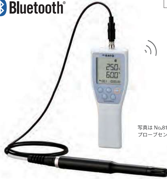
写真は No.8140-20 プローブセンサセットです