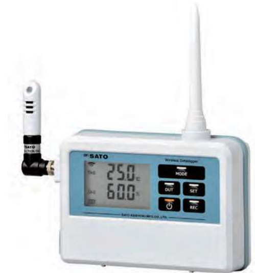
CH1: 一体センサ ※センサは別売りです