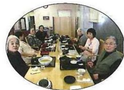
おいしい料理に満足満腹♪