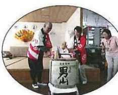
鏡開きもいたしました!

「海鮮鍋」と「ちゃんこ鍋」を作る事から始まりました。出来上がった鍋は昼食として利用者・ご家族様・職員が同じテーブルで一緒に食べました。