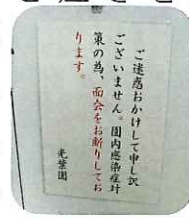
ご協力ありがとうございました。

4月からホーム看護スタッフに新メンバーが加わりました。スタッフ一同力を合わせ、入居者の方々と楽しい時間を共有していきたいと思っています。世間話し相談まで、何でも気軽に声を掛けて頂けると嬉しいですよ。よろしくお願い致します。