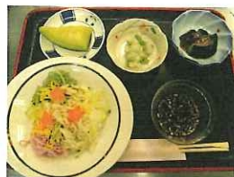
彩りよく 美味しそうです