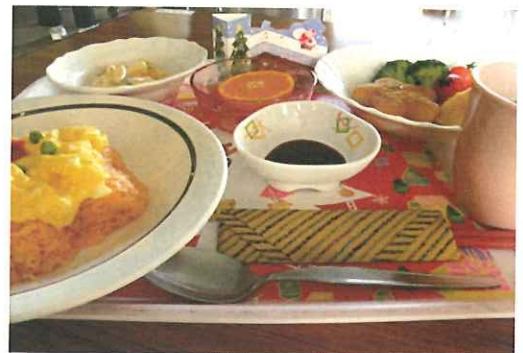
クリスマスメニュー♪