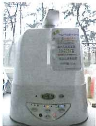
消毒液の加湿器です