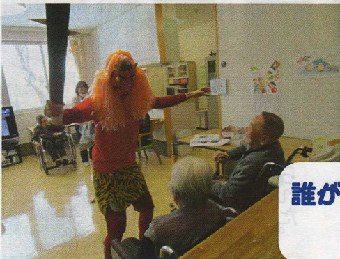
誰が鬼だがわがってるけど おっがねえ

平成29年2月2日(木) 豆まきの歌を歌いながら、登場した鬼に豆をぶつける。 おそろおそろ玉をぶつける人、職員と分かっているのか優しく笑顔で投げる人、鬼の顔をめがけて投げる人、遠慮がちに投げない人、などその方の性格が出ていたのではないのでしょうか。 最後は、甘酒と落花生を美味しく召し上がっていました。 (茨島)