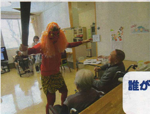
誰が鬼だがわがってるけど おっがねえ

平成29年2月2日(木) 豆まきの歌を歌いながら、登場した鬼に豆をぶつける。 おそろおそろ玉をぶつける人、職員と分かっているのか優しく笑顔で投げる人、鬼の顔をめがけて投げる人、遠慮がちに投げない人、などその方の性格が出ていたのではないのでしょうか。 最後は、甘酒と落花生を美味しく召し上がっていました。 (茨島)