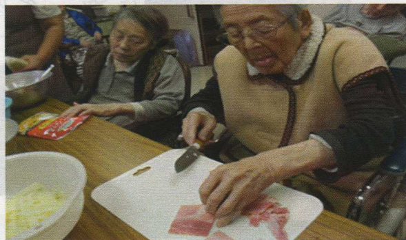
4丁目手作りクッキング