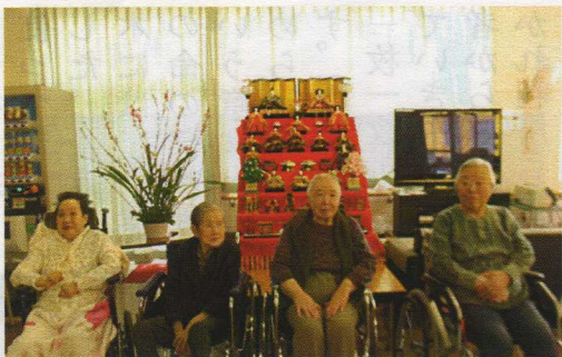
きれいどころは誰?