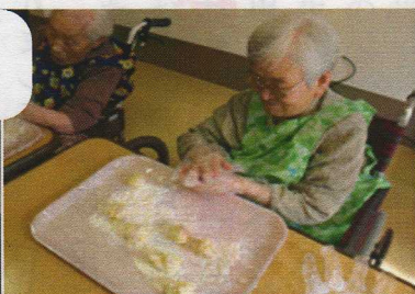
じゃがいもパン作り