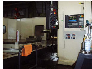
横中グリ 東芝 2000 X 1500 X 1980まで加工可能