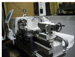
NC汎用旋盤 650φ X 1475