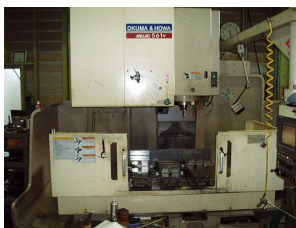
オークマホーワ マシニング 1000 X 500 X 500まで加工可能