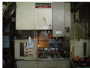
オークマV6マシニング 1000 X 500 X 500まで加工可能