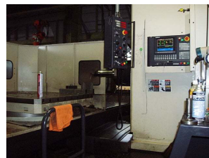
横中グリ 東芝 2000 X 1500 X 1980まで加工可能