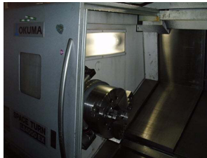
CNC施盤 LB4000 E X 400φ X 1450まで加工可能