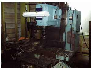
フライス 950 X 400 X 400まで加工可能