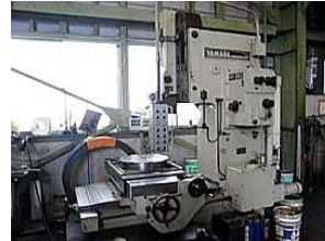
スロッターストローク350 1000φ