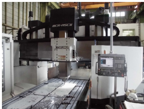
五面加工機 オークマ 5000 X 2000 X 1400まで加工可能