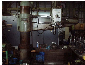
ラジアルボール盤 1450 X 1000 X 1000まで加工可能