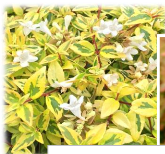
カレードスコープ®