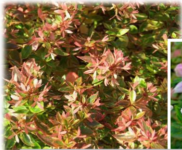
サンシャインデイドリーム®