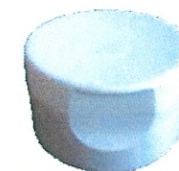
φ30~50スクリューキャップ φ30~50ヒンジキャップ