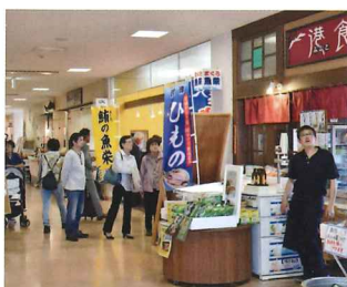
お土産にひもの物色