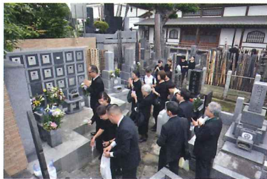
(下) 新盆供養後の境内