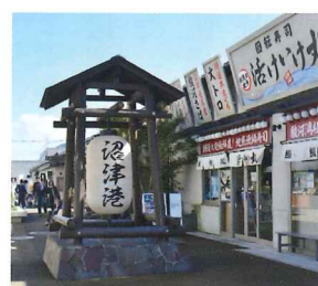
味処『ぬまづみなど』の一角