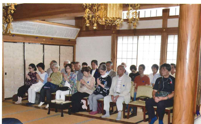
歓迎を受ける参加者