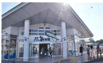
買い物を楽しんだ新鮮館