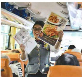
帰りのバスでの抽選会