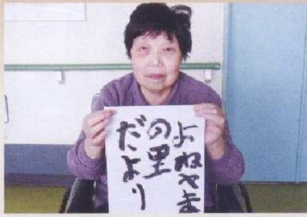
心を込めて書きました。