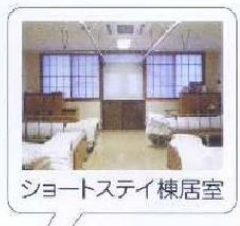
ショートステイ棟居室