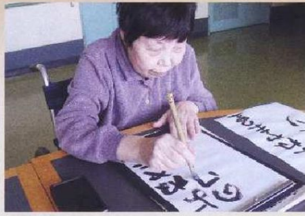
お手本を見ながら慎重に..