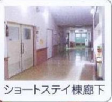
ショートステイ棟廊下