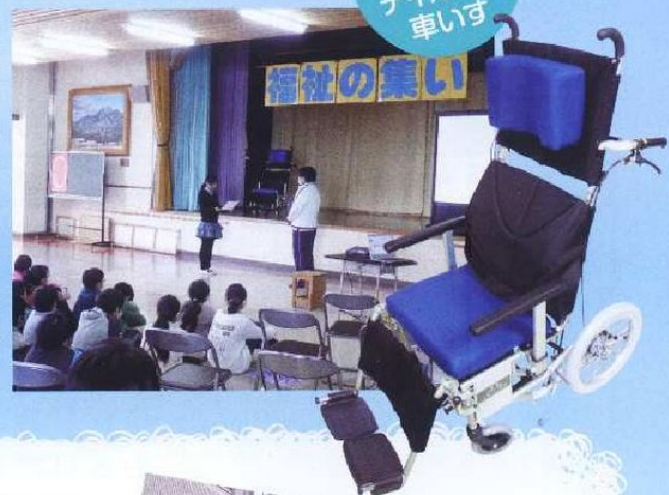
ティルト式 車いす

平成25年2月26日(火)下黒川小学校様企画の「福祉の集い」に参加させて頂き、年間を通し行われた「アルミ缶活動」にて集められた活動の収益より、ティルト式車いす1台とタオルセットを寄贈して頂きました。下黒川小学校様の「アルミ缶活動」は今年で22年目になります。編集後記に、「小学生の時の、この経験が今の支え」とのコメントに改めて歴史と、取組みの伝統と重さを痛感します。寄贈されたティルト式車いすは、よねやまの里にて大切に使用させて頂きます。下黒川小学校の皆様とご協力頂きましたPTA生活部の皆様、アルミ缶をご寄付して頂いた地域の皆様ありがとうございました。