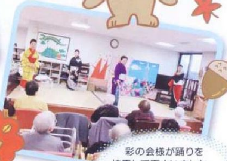
彩の会様が踊りを 披露して下さいました。 華麗な踊りに皆さん うっとり。