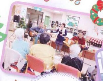
フォークソングバンド 「あぜ道」様の クリスマスコンサート。 懐かしい歌に手拍子や リズムを合わせ 唄いました。