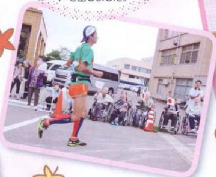
100kmマラソンの 応援に出掛けて、 精一杯 声を出しました。