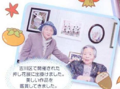
吉川区で開催された 押し花展に出掛けました。 美しい作品を 鑑賞してきました。