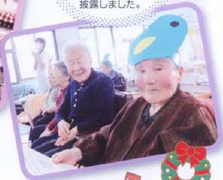
平成24年の 締めくくりに 忘年会を行ない、 練習してきた歌を 披露しました。