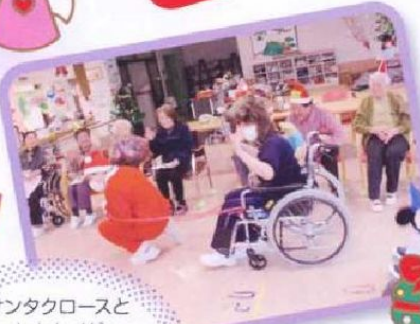
サンタクロースと トナカイが 素敵なプレゼントを 届けてくれました。