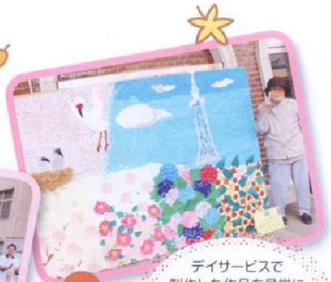
デイサービスで 制作した作品を見学し 城下町高田花ロードへ 出掛けてきました。