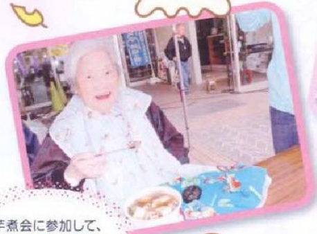
芋煮会に参加して、 見たつぷりの芋煮を 食べてきました。