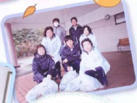
地域ボランティアとして、 柿崎6区と山谷地区の中心に ゴミ拾いを行いました。 袋一杯ゴミが集まりました。