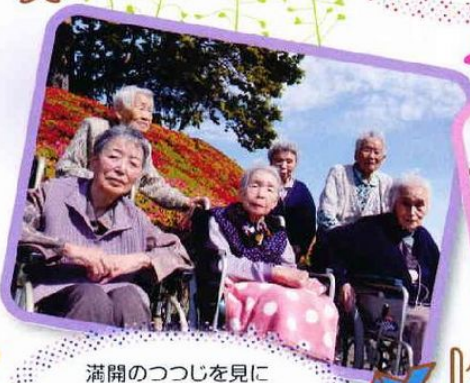
満開のつつじを見に 「米山水源カントリークラブ」に 出掛けてきました。