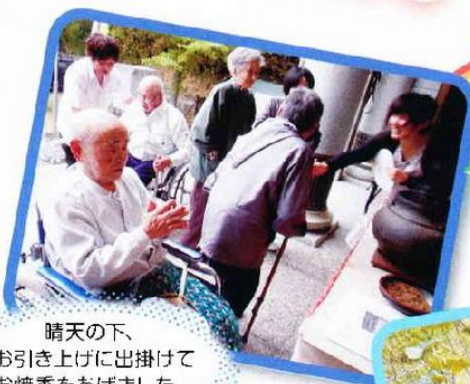
晴天の下、 お引き上げに出掛けて お焼香をあげました。