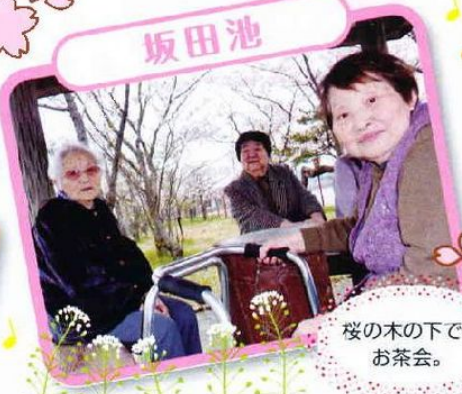
桜の木の下で、 お茶会。