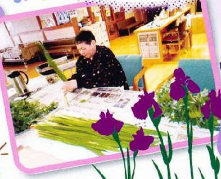
香り豊かな菖蒲を使って、 菖蒲湯を楽しみました。