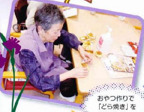
おやつ作りで 「どら焼き」を 作りました。