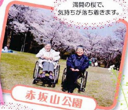
満開の桜で、 気持ちが落ち着きます。