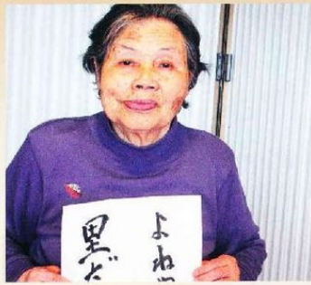
きれいに書けました。