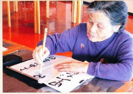
一生懸命がんばっています。