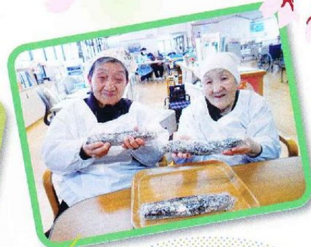
節分といえば 「恵方巻き」。 美味しくいただきました。