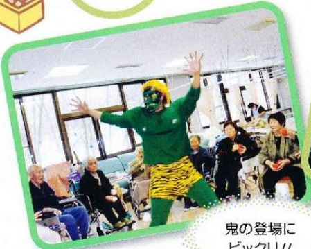
鬼の登場に ビックリ!!