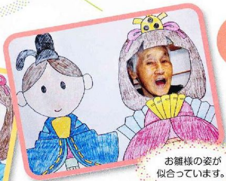
お雛様の姿が 似合っています。