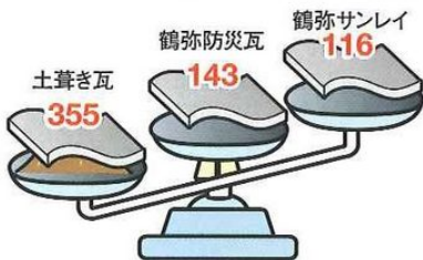
屋根材別重量比較(坪当たり)単位:kg