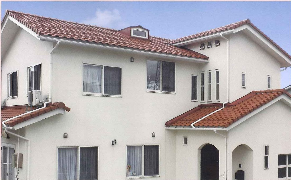
ライトレッド使用