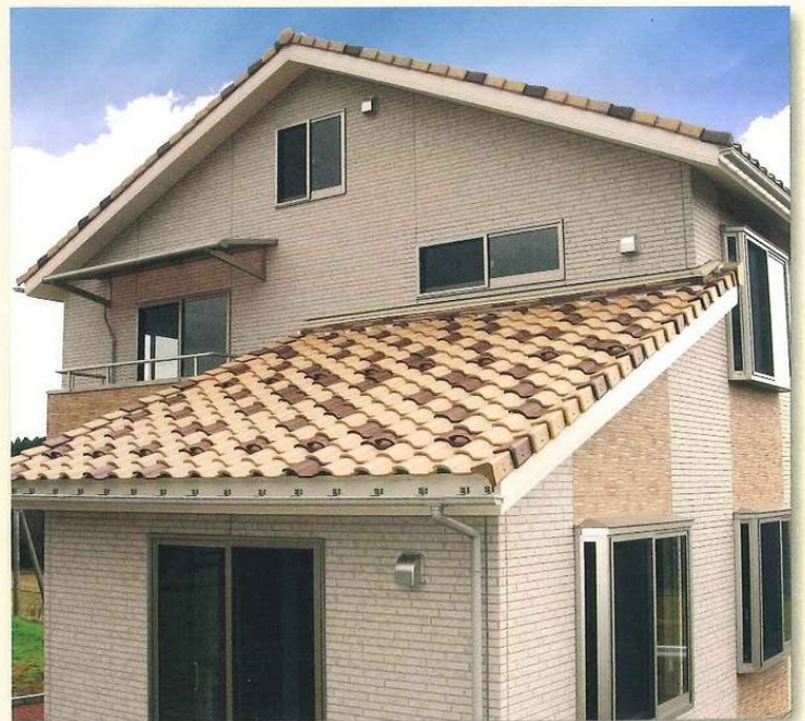
ライトブラウン・ライトイエロー混ぜ葺き