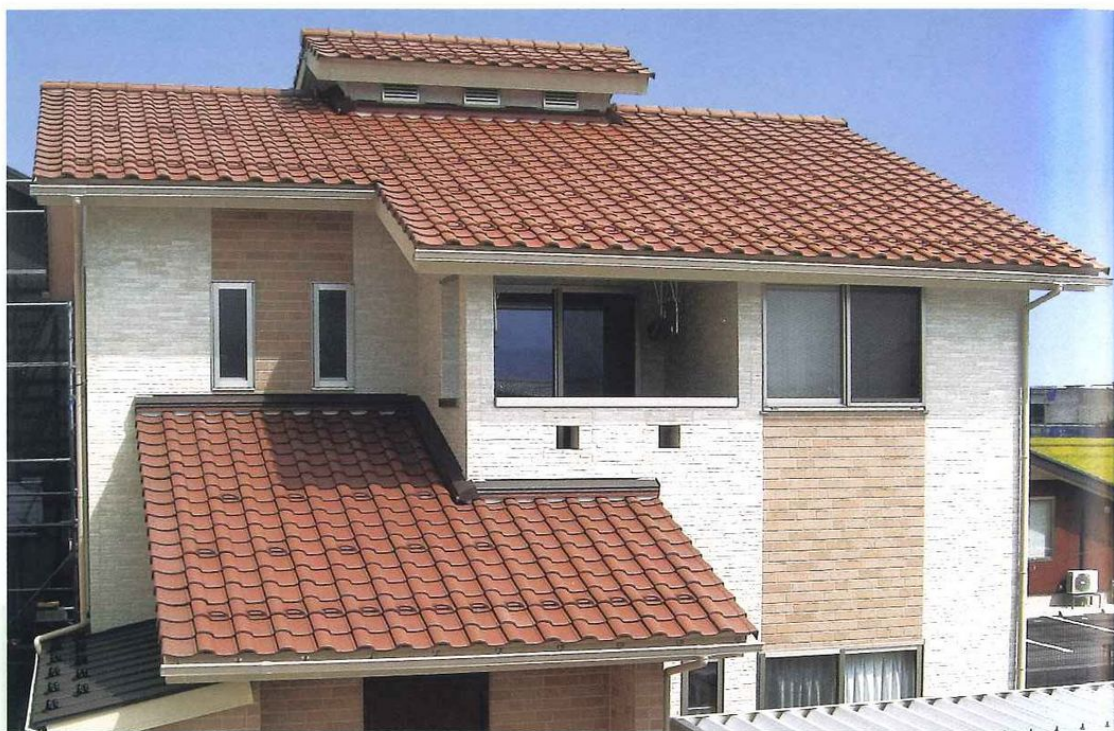
ライトブラウン使用

ヨーロッパのエスプリを感じるフォルムとカラー 伝統に培われた強さと美しさこそフレアスタイルです