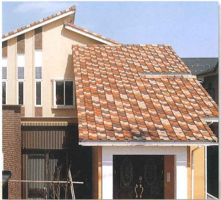
ライトブラウン・ライトレッド・ライトイエロー混ぜ葺き