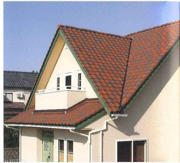
ライトブラウン・ライトレッド混ぜ葺き