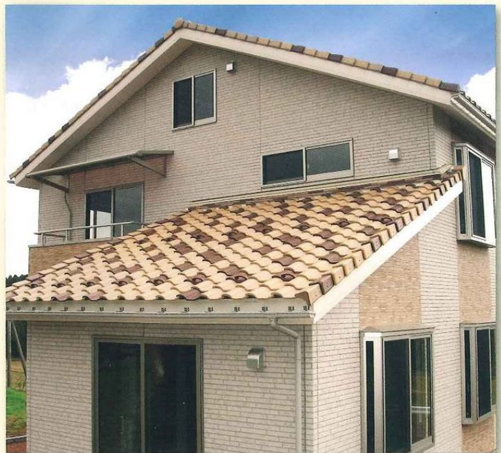
ライトブラウン・ライトイエロー混ぜ葺き