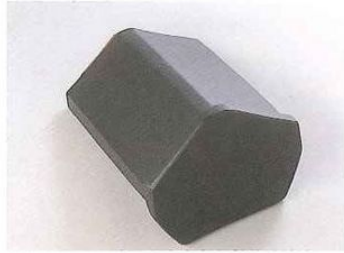
■和型三角冠振止(ひもなし)