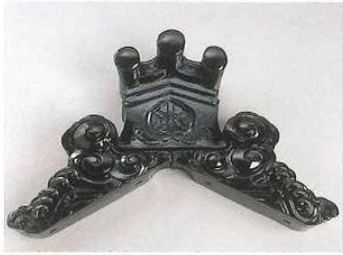
■経の巻三ツ切瓦跨鬼(御所三ツ切)