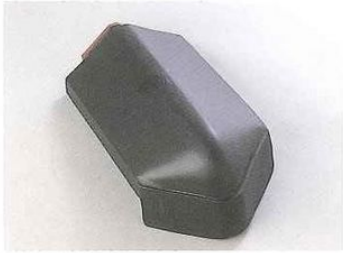
■三角冠振隅止(かっぱん)