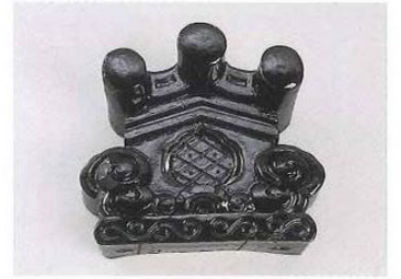
■経の巻降り鬼(御所座鬼)