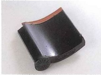
■特紋唐草羽口(16枚菊)