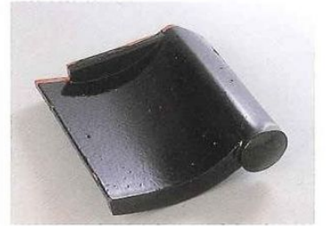
■目戸付箕甲羽口左