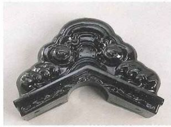
■覆輪跨鬼8寸(丸くら8寸)