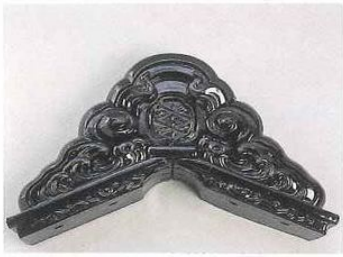
■覆輪三ツ切り跨鬼(丸三ツ切)