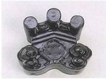
■経の巻隅鬼(御所隅鬼)