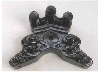
■経の巻跨鬼(6~9寸) [御所くら鬼]