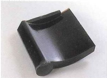
■目戸付箕甲羽口右