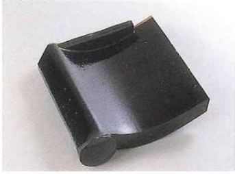
■目戸付箕甲羽口右