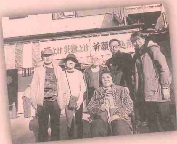
2020年最初の記念写真